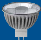
DELUXE MM27102 warmweiß GU5.3/4W